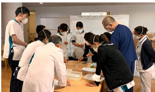
お薬について多職種で勉強中

急性期治療を終えて状態が安定しても引き続き病院での治療・療養を必要とする方を対象とし、看護・介護・リハビリテーションなど必要な医療が受けられる病棟です。医療の必要性が高く療養生活を維持しなければならない方が入院生活を送っています。看護師・介護士の配置は20：1で、急性期よりも少ない人数となりますが、経験豊富なスタッフでケアを行っています。