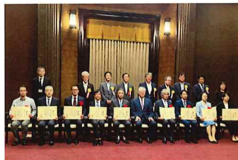
鈴木病院長：前列 左から4人目