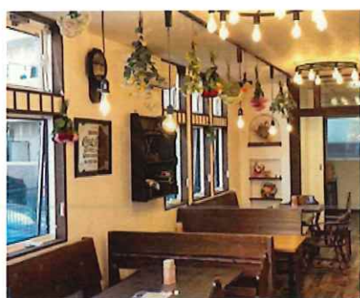
アンティークな雰囲気店内