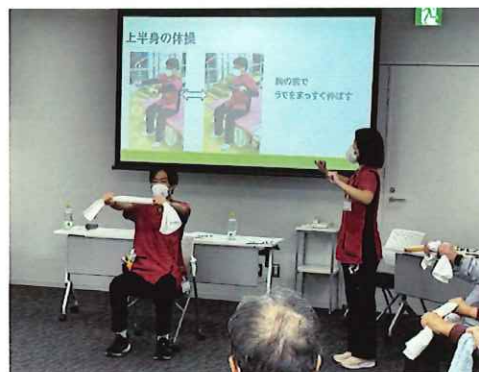
前回の教室の様子

電話、FAX、メールまたは藤沢市のホームページの「電子申請・申請書ダウンロード」よりお申込みいただけます。