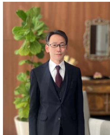
読書家の海藤施設長

先日読んだ本に「恩送り」という言葉がありました。恩を次の人や世代に伝えていく事、「善意の連鎖」という意味だそうです。私もこの16年間の経験や感謝の気持ちを次へと繋げていけるよう意識するようになりました。