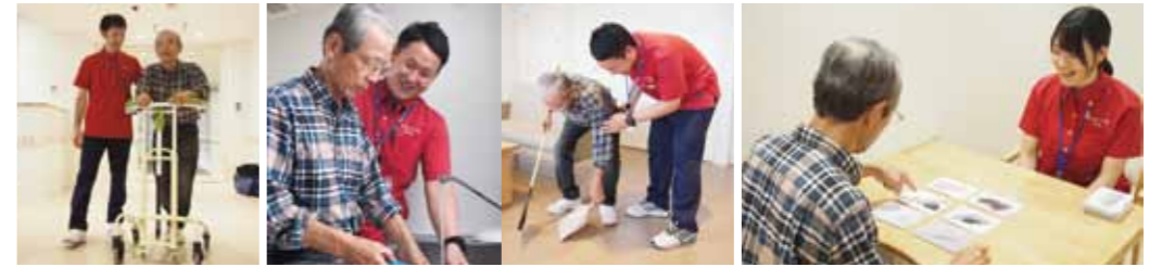
理学療法士による 歩行練習