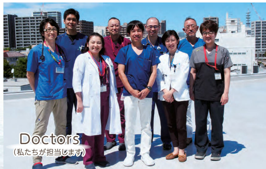
Doctors (私たちが担当します)

診療科目： 内科・脳神経内科・腫瘍内科・ 緩和ケア内科・呼吸器内科・消化器内科 循環器内科・リハビリテーション科・ アレルギー科・リウマチ科・皮膚科・ 各種健康診断